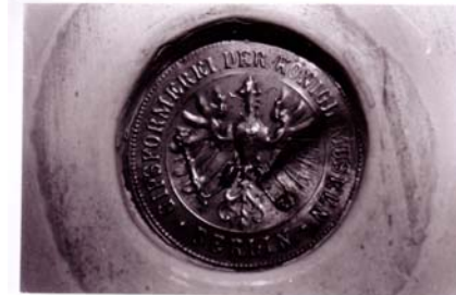
GIPSORMEREI DER KÖNIGL. MUSEEN-BERLIN Estampille de forme circulaire en laiton.