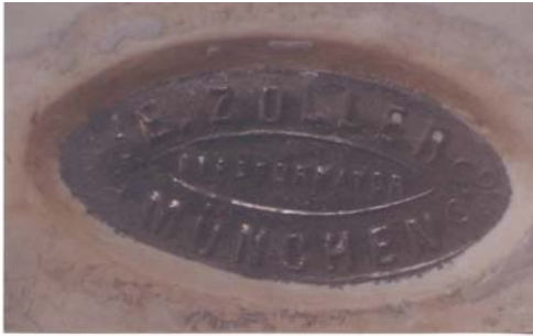
E. ZOLER-MÜNCHEN Estampille de forme ovale en métal, au centre dans un ovale : GIPSFORMATOR.