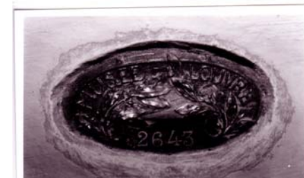
MUSÉE DU LOUVRE Estampille ovale en métal étamé

Toutes ces photos appartiennent au musée de moulages. Lyon 2.