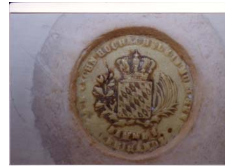
K. B. TECHN. HOCHSCHULEIN MÜNCHEN Estampille de forme circulaire en cire