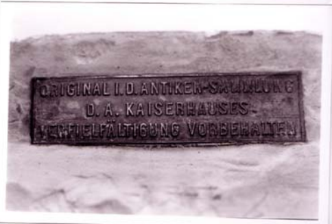
ORIGINAL I. D. ANTIKEN-SAMMLUNG / D. A. KAISERHAUSES / VERFÄLTERUNG VORBEHALTEN Estampille de forme ovale en laiton