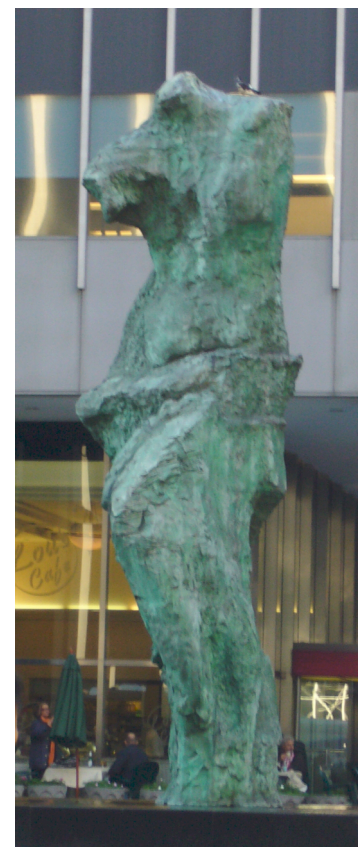
Jim Dine, Venus , 1991. Manhattan, Sixth Avenue.