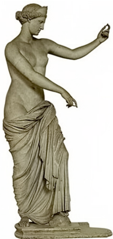
Vénus de Capoue . Copie romaine d'un bronze du IV e siècle avant J.-C.

Dépourvue de ses bras et du pied gauche, elle est néanmoins dans un bon état de conservation malgré quelques marques dues à son transfert jusqu'en France. La statue est constituée de deux blocs de marbre de Paros, travaillés en ronde bosse et joints au niveau de la draperie. Selon la technique des pièces rapportées, plusieurs parties sculptées séparément sont assemblées ensuite par scellements.