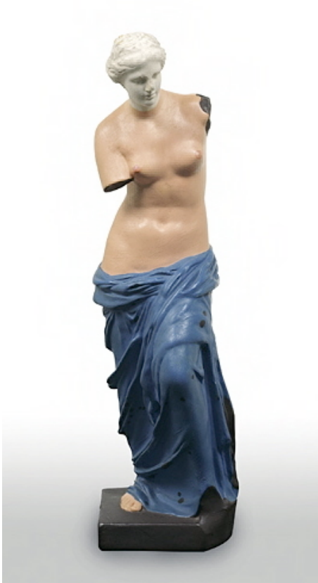
René Magritte, Les menottes de cuivre , 1931. 37x11,5x11. Huile sur reproduction en plâtre de la Vénus. Musée des Beaux Arts de Belgique, dép. Art Moderne, Bruxelles.

Les quelques exemples de fortune critique ici présentés ne sont qu'une présentation infime de toutes les évocations de la Vénus de Milo.