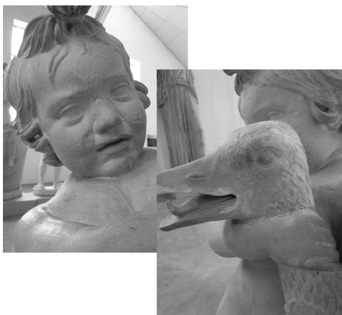
Détails des têtes de l'enfant et de l'oie.

La sculpture face à laquelle nous sommes, montre la tête de l'oie nous regardant dans une sorte d'appel au secours, tandis que l'enfant observe l'oie et ne paraît pas effrayé par ce qu'il est en train de faire. On sent la crainte et la frayeur dans le regard de l'oie.