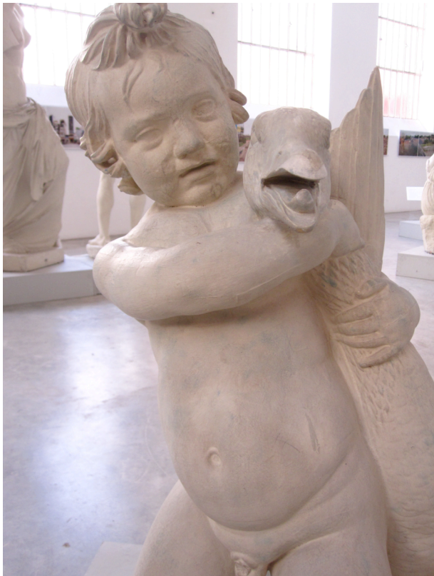
Vue de face de L'Enfant à l'oie

La sculpture face à laquelle nous sommes, montre la tête de l'oie nous regardant dans une sorte d'appel au secours, tandis que l'enfant observe l'oie et ne paraît pas effrayé par ce qu'il est en train de faire. On sent la crainte et la frayeur dans le regard de l'oie.