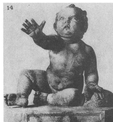
© O.Hirsch-dyczek. Les représentations des enfants sur les stèles funéraires attiques. 1983.

L'Enfant à l'oie n'est donc pas un cas particulier, il s'ancre dans une certaine mode de la représentation des enfants accompagnés d'animaux. Ce qui semble plus original dans cette statue, est la volonté d'étrangler l'oiseau, qui traduit une représentation de l'enfance bien particulière, loin des scènes candides. La question qui peut se poser serait, pourquoi Boéthos voulait-il montrer un aspect aussi cruel de l'enfance?