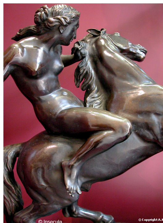
Jean-Jacques Feuchère, Amazone domptant un cheval sauvage , Sculpture de bronze, 1843, Musée du Louvre, Paris