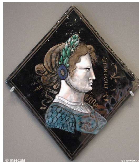
Inconnu, Penthesilée : la reine des Amazones , Email peint, 1550-1600, Musée du Louvre, Paris