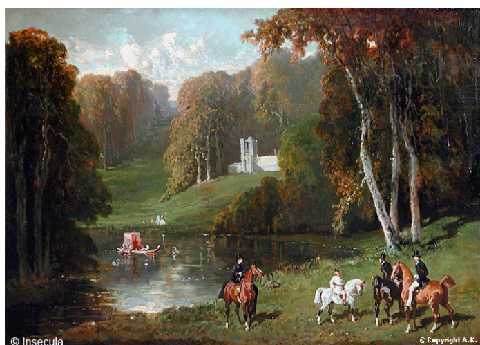
Alfred de Dreux, Cavaliers et Amazones au bord d'un lac , Peinture à l'huile sur toile; vers 1859, Musée du Louvre, Paris

Le motif des amazones a beaucoup été repris à travers les siècles car l'image de cette femme guerrière a fasciné. Elles sont devenues des figures légendaires à travers les siècles, alors qu'elles ne sont au début qu'un simple mythe. Au fur et à mesure, l'intérêt qui leur a été porté, a multiplié les histoires dont elles furent les protagonistes. Ainsi, le motif de l'amazone s'intensifie dans les textes notamment pour les récits de batailles et se développe également dans le domaine artistique.