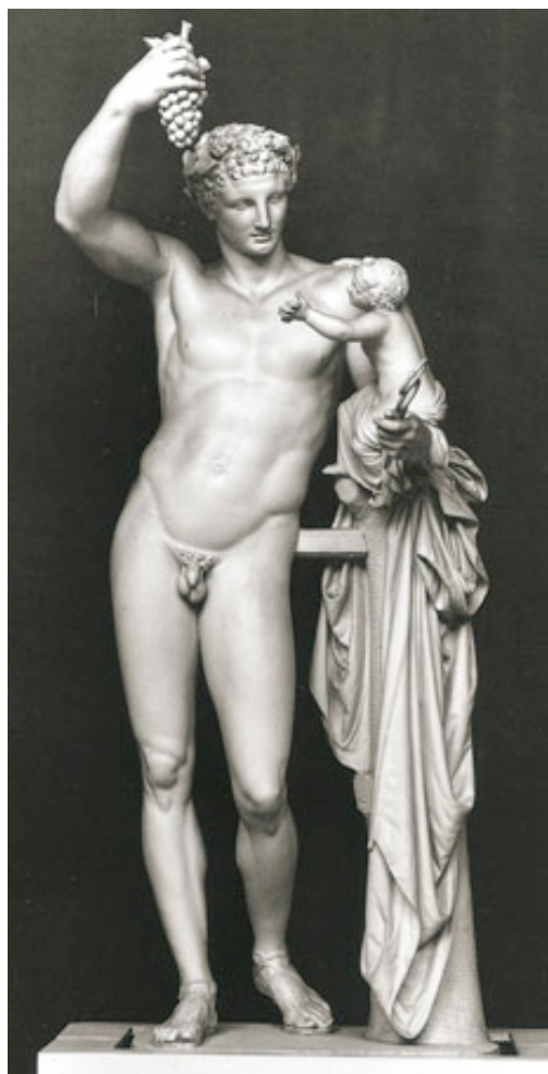
Reconstitution de l' Hermès portant Dionysos

Le manteau d'Hermès déposé sur le tronc d'arbre peut surprendre. En effet, les plis du vêtement sont plus réalistes qu'idéalisés.