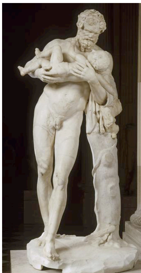
Silène portant Dionysos enfant, dit Faune à l'enfant, Paris, musée du Louvre

Cet épisode du repos des deux protagonistes est souvent représenté. Parfois, l'Hermès est remplacé par un silène, on peut d'ailleurs en trouver un moulage dans ce musée.