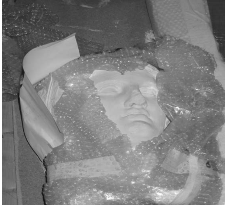
15.Réserve au troisième musée des moulages de Lyon