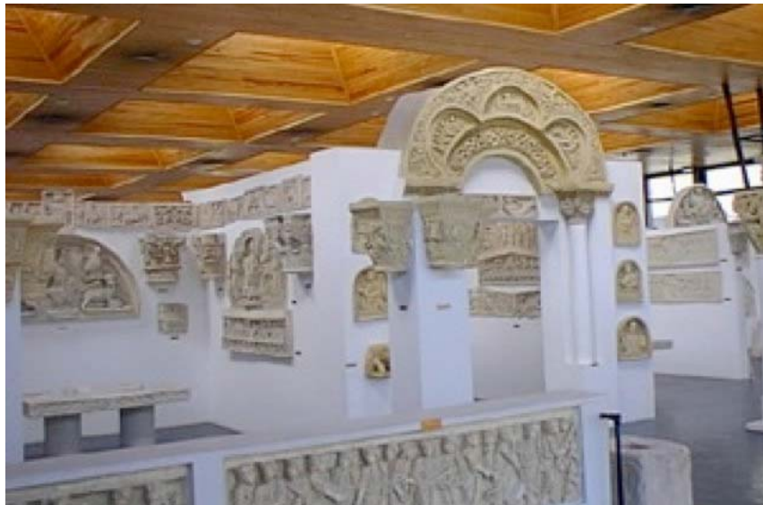
7. Musée Empereur Antonin, salle médiévale

Le nouveau musée, conçu par les architectes Jaulmes, Desmons et Egger occupe 1150m 2 . D'un plan rectangulaire, il est éclairé par des fenêtres sur le côté ainsi que de manière naturelle par des ouvertures dans le plafond 18 . Les moulages y sont rangés selon un ordre chronologique sur deux pièces. La pièce au sud-est comprend les sarcophages paléochrétiens, les frises, les chapiteaux et la statuare de la collection médiévale. La deuxième pièce, quant à elle, comprend les pièces maîtresses de l'Antiquité comme le groupe du Laocoon , la Victoire de Samothrace ou bien encore les frises du Parthénon de la collection antique allant de l'Archaïsme jusqu'à l'Hellénistique.