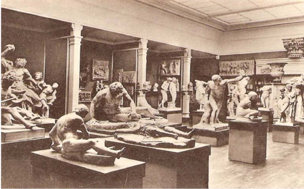
9. Salle IX au 18, quai Claude Bernard

Le deuxième étage du bâtiment commun au Droit et aux Lettres fut presque entièrement occupé par la collection antique. Le reste fut utilisé par la Faculté de Géographie. Il fut disposé en U à trois galeries avec une rotonde au centre. 24 La rotonde, quant à elle, se tenait juste au-dessus du grand Amphithéâtre. Les murs extérieurs créaient des niches par des renforcements où l'on pouvait également exposer des moulages. Chacun des murs donnant sur la cour était flanqués de quatre pilastres. La lumière était naturelle et provenait d'une part de hautes fenêtres avec de larges baies vitrées et de l'autre d'une verrière couvrant une grande partie du toit. L'éclairage zénithal et le décor néoclassique avec les pilastres et les murs d'un rouge "pompien" rappelaient les musées d'originaux.