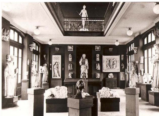
11.La collection moderne au 18, quai Claude Bernard

d'Histoire de l'art. 28 La collection moderne fut installée au 18, quai Claude Bernard. Elle y occupait trois salles de l'aile ouest de la cour Charles Dugas .