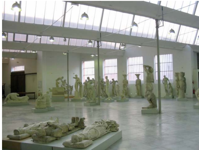
12. Le troisième musée : halle d'exposition

Une petite salle de cours se trouve au sous-sol, à côté des réserves. Une autre réserve se situe au rez-de-chaussée. Non loin de cette réserve se trouvent les archives et un bureau. Il y a également un petit atelier donnant sur la cour intérieure du complexe immobilier.